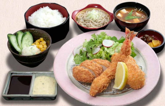
吹き寄せ御膳…2,220円 (税込2,442円) 魚のフライは かきフライ(2個)にも替わります (かきの季節のみ)