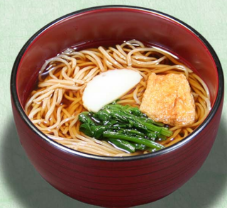
ミニそば...520円 (税込572円)