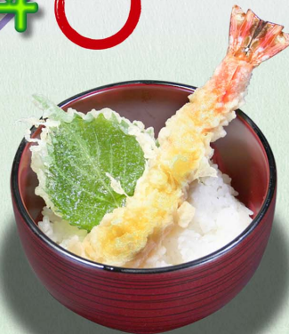
大えび天丼...690円 (税込759円)