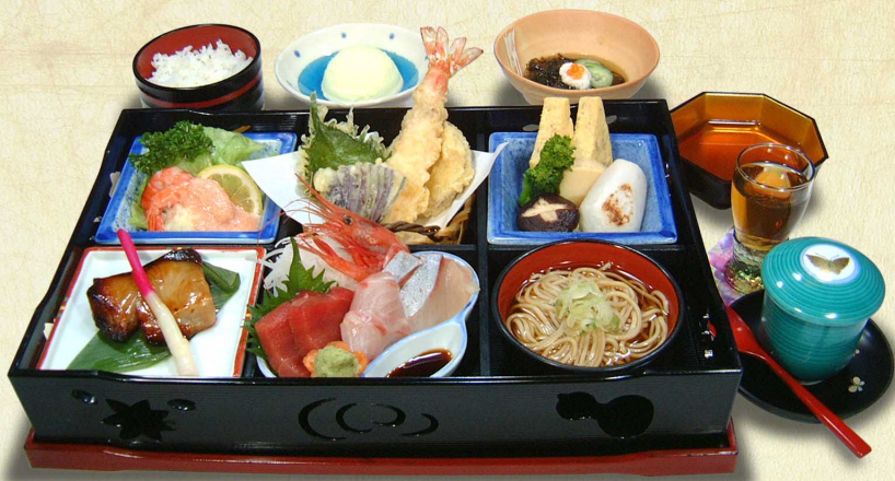
松花堂弁当“雅 みやび”…2,980円(税込3,278円)