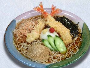
えびおろしそば 1,560円(税込1,716円)