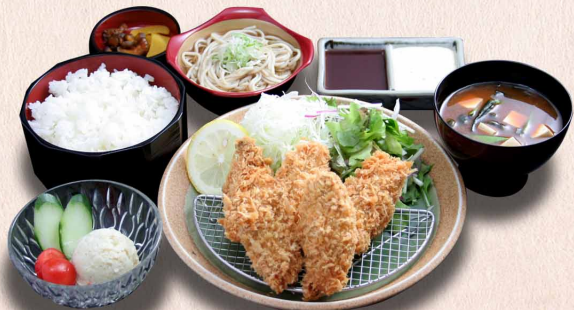
かきフライ御膳 (3個) …1,800円 (税込1,980円) (5個) …2,410円 (税込2,651円)