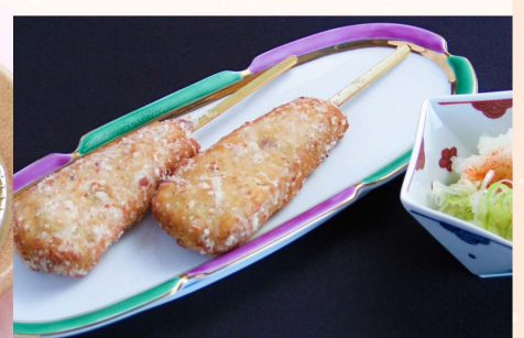
つくねおろし…500円 (税込550円)