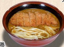
大勝 カレーうどん…1,700円 税込1,870円