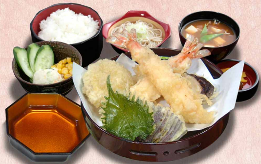
天ぷら御膳(えび2本)…1,990円 (税込2,189円) (えび1本)…1,760円 (税込1,936円)

かきフライ御膳 (3個) …1,800円 (税込1,980円) 厳選された大粒の牡蠣 (5個) …2,410円 (税込2,651円)