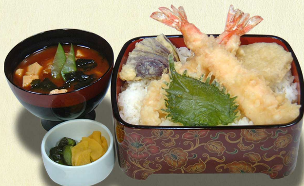
えび天重…1,480円 えび二尾、野菜3種 (税込1,628円)