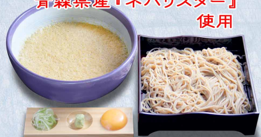
とろろ箱そば…1,540円(税込1,694円) 麺の大盛り+とろろ汁も大盛りは+580円(税込638円) 〈別売〉箱そば汁セット…150円(税込165円)