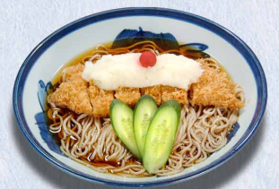
勝おろしそば 1,460円(税込1,606円)