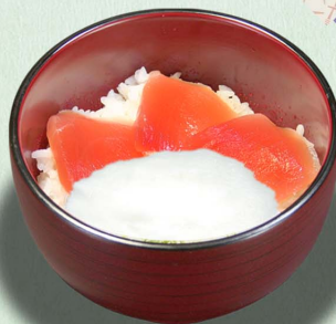
山かけ丼...580円 (税込638円)