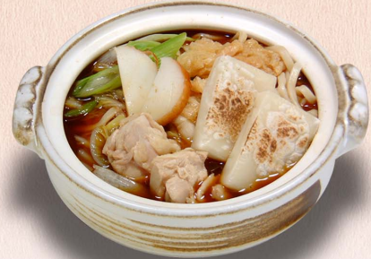
餅2個入り...1,330円 (税込1,463円)