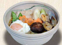
五目そば…1,230円 (税込1,353円)