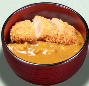
サクサク カレー丼...610円 (税込671円)