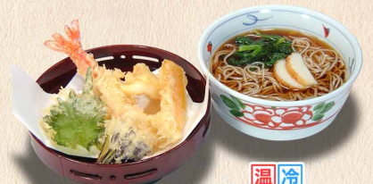
えび天ぷらそば …1,250円(税込1,375円)