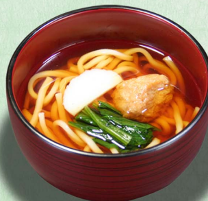
ミニうどん...520円 (税込572円)