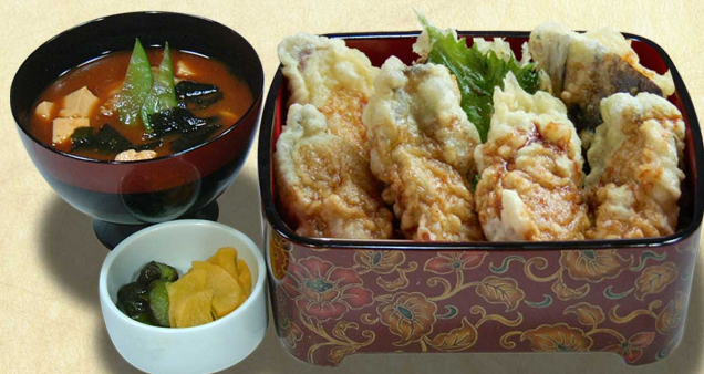
【季節限定】 かき天重…1,960円 10月～3月中旬 大粒のかき天ぷらが4個(税込2,156円)