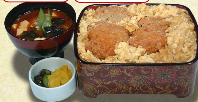
ヒレかつ重…1,280円 柔らかヒレかつ (税込1,408円)