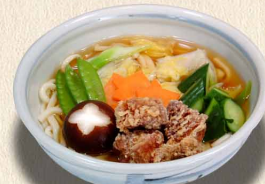
長寿うどん…1,250円 (税込1,375円)