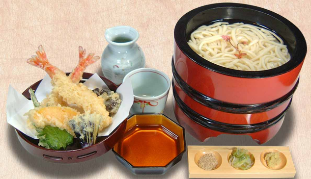
天ぷら釜揚げうどん えび天2本…1,890円(税込2,079円) えび天1本…1,660円(税込1,826円)