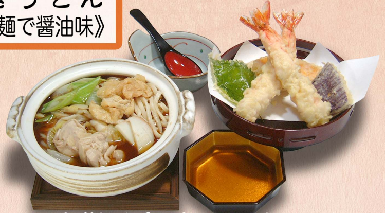
天ぷら付き えび天2本...1,940円(税込2,134円) えび天1本...1,710円(税込1,881円)