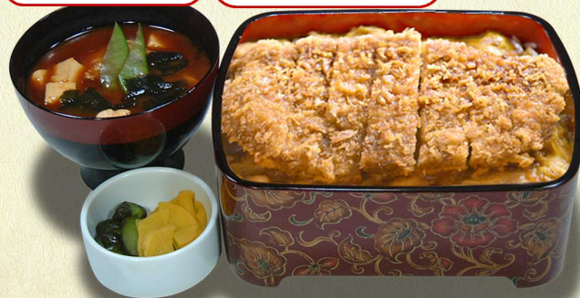
ローズかつ重…1,280円 柔らか大判ローズかつ (税込1,408円)