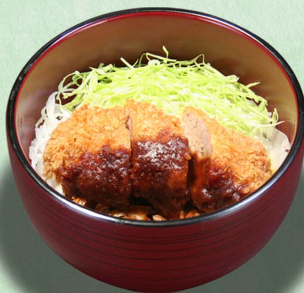
みそかつ丼...580円 (税込638円)