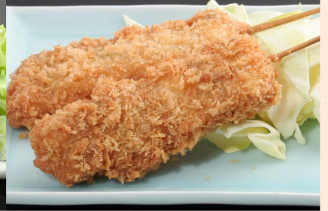
串かつ2本...550円 (税込605円) 3本...790円 (税込869円)