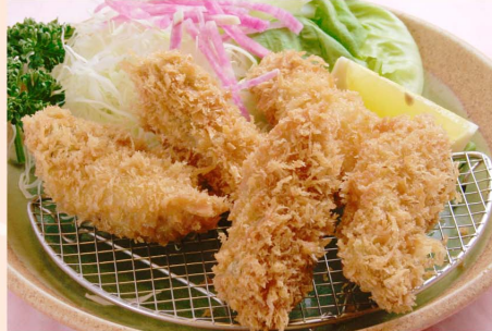
かきフライ5個...1,900円 (税込2,090円) 3個...1,260円 (税込1,386円)