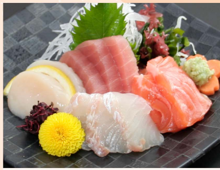
お刺身の盛り合せ...1,580円 (税込1,738円) ※刺種は仕入れにより替わります