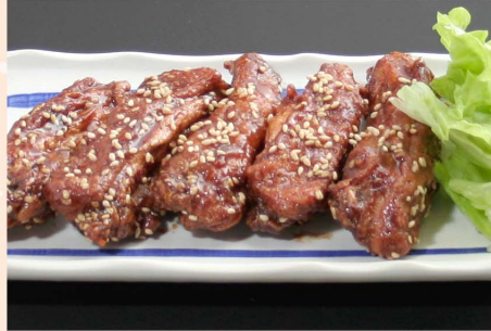
ピリ辛チキン...550円 (税込605円)