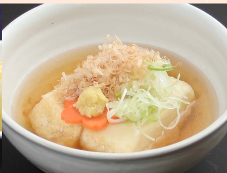
揚げ出し豆腐...550円 (税込605円)