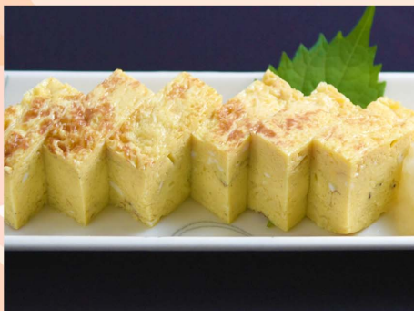
だし巻き玉子...550円 (税込605円)