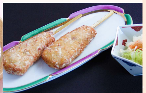
つくねおろし...500円 (税込550円)