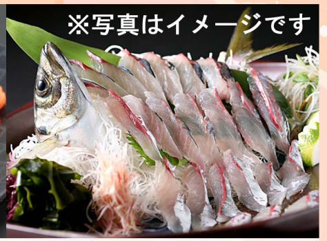
※写真はイメージです 毎日替わる『おすすめのお造り』 いろいろ取り揃えております 係の者におたずねください