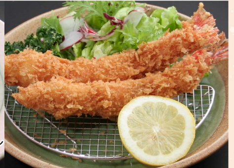
エビフライ...890円 (税込979円)