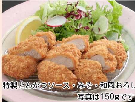
特製とんかつソース・みそ・和風おろし 写真は150gです