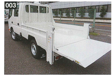
背の高い積荷や、揺れを嫌う積荷に最適な垂直昇降式です。