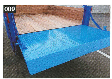
衝撃・ぐらつきを抑えるブレーキバルブを装備しています。