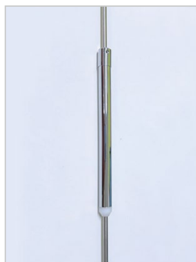
振動軽減管 メインエレメント内で上下させてください。設置しなくても問題ありません。