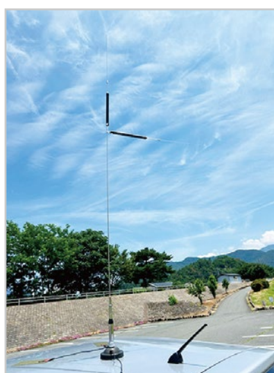
自動車への設置例 必ずアースを設置してください。