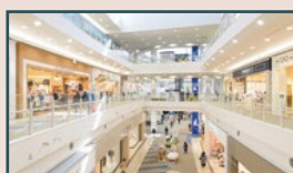
テナントショップ