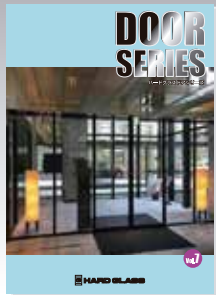
■総合ハードグラスドアシリーズ