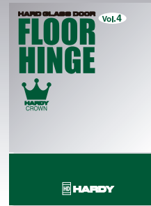
■耐久性の極め[ハーディクラウンヒンジ]