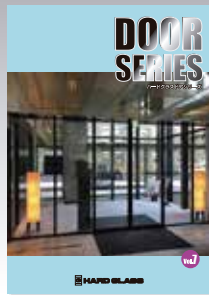
■優しい光を[ハードペアガラス]