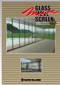
■ガラスの間仕切り ガラスムーブスクリーン