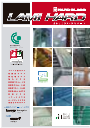
■ 多機能合わせガラス -----[ラミハード]