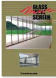
■ ガラスの間仕切り [ガラスムーブスクリーン]