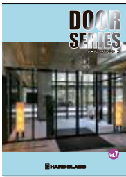
■ 総合ハードグラスドアシリーズ

関連商品カタログをご参照ください。(ホームページからダウンロードしていただけます)