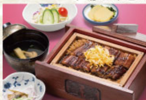
◆セイロむし(特上) 3,850円