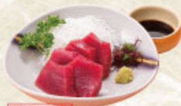
数量限定 まぐろの刺身 1,100円