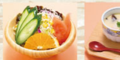
◆野菜サラダ 440円 ◆茶わん蒸し