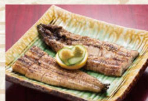
◆うなぎ塩焼(2人前) 4,620円