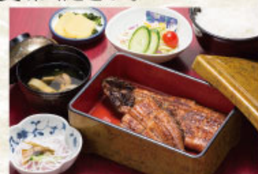
◆うなぎ定食(特上) 3,850円