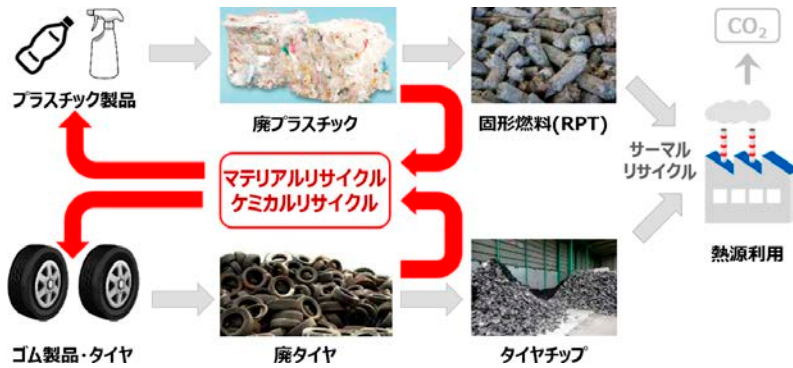
図30 ケミカルリサイクルについて