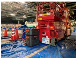
蓄電池（太陽光）を利用した高所作業車の充電