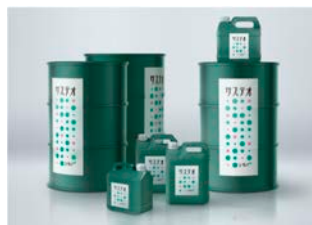
バイオディーゼル燃料の活用