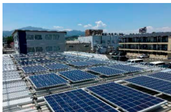
現場事務所へ太陽光パネルの設置