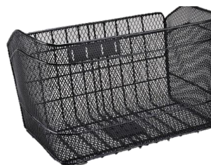
メタリックブラック