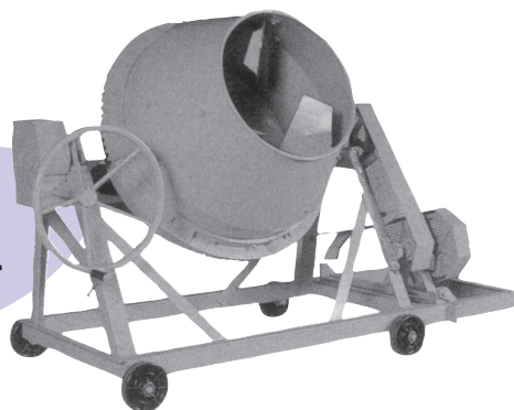
コンクリートミキサー (エンジン)