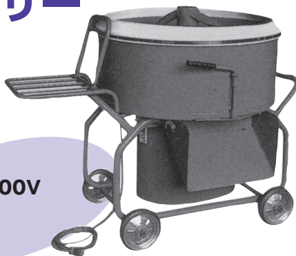
モルタルミキサー 100V