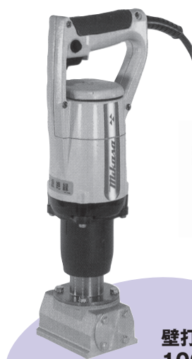
壁打バイブレーター 100V