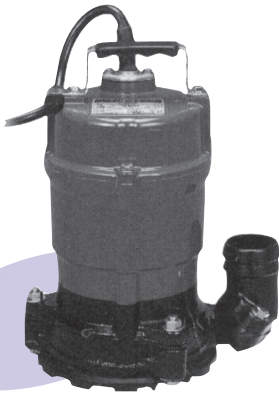
スーパーパーポンプ 100V