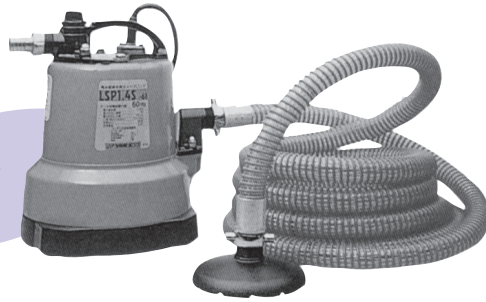
残水自吸式ポンプ