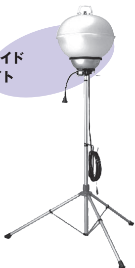
メタルハライド ボールライト 100V