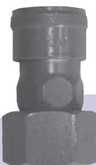
プラント用カブラ 4分カブラ→4分メスネジ