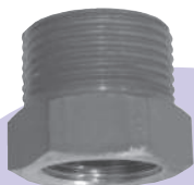
スパット 6分ホース用 (レンタル)