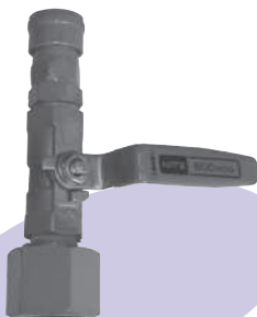
プラント用カブラ(コック付) 4分カブラ→6分メスネジ