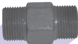
Wスパット 6分ホース用 (レンタル)