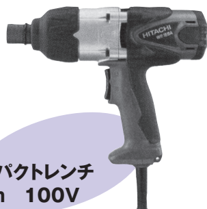
電動インパクトレンチ 12.7mm 100V