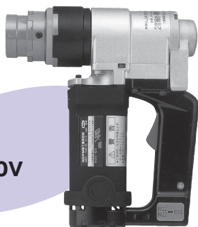
一次締めレンチ 100V (TCボルト用)