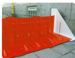
▲サイドアタッチメント