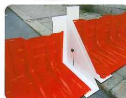
▲段差対応アタッチメント