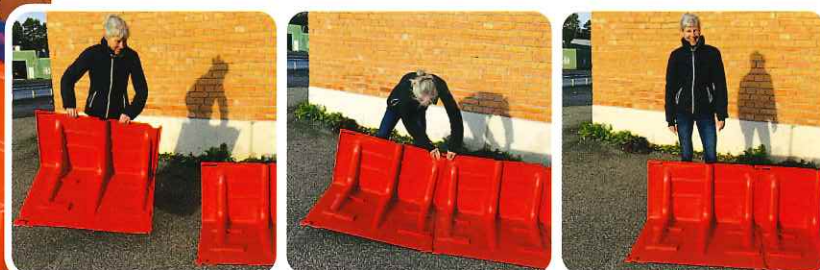
▲設置は、ボックスウォールを背後から見て左から右に並べる

Boxwallは特殊な工具やスキルを必要とせず設置ができ、ユニットのジョイント部(▼印)をつなぐことができます。各ジョイント部は±3度の調節ができ、カーブした設置場所でも対応可能です。