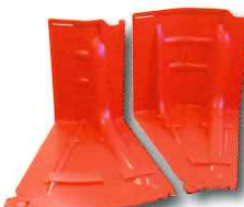
アウトコーナー(左)インコーナー(右)▶