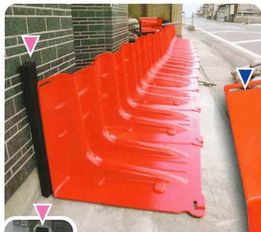
ボックスウォールの背後に壁がある場合はシーリング材を使用