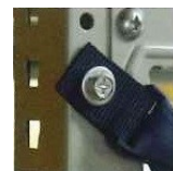
● 粘着付金具 (裏面強力粘着パッド)