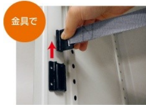
金具で ベルトの取り付け・取り外しが片手でできるので効率的です。