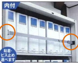
内付 粘着・ビス止め 選べます