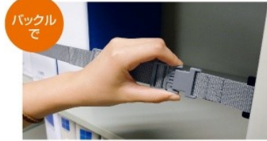
バックルで バックルでも取り付け取り外しできます。