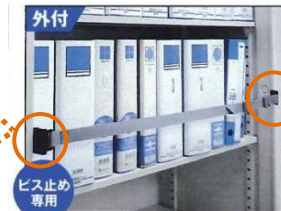
外付 ビス止め 専用