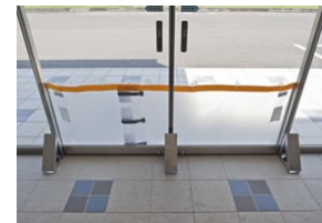
フロントタイプ屋内側