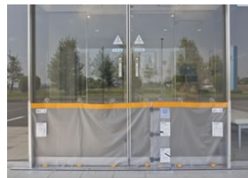
フロントタイプ屋外側