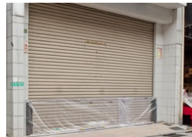
シャッタータイプ