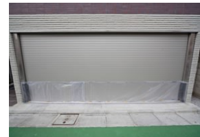
シャッタータイプ