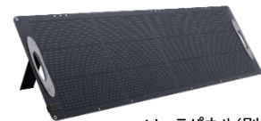
ソーラーパネル(別売)