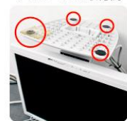
モニターベース部(四隅)にゲルシールを貼るだけ