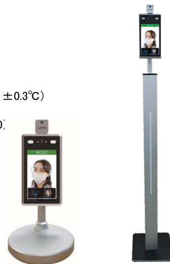
デスクトップ型(オプション) スティック型(オプション)

顔認識を一括登録。 測定記録書き出し機能。 マスクありなしを検知。 音声でお知らせ。